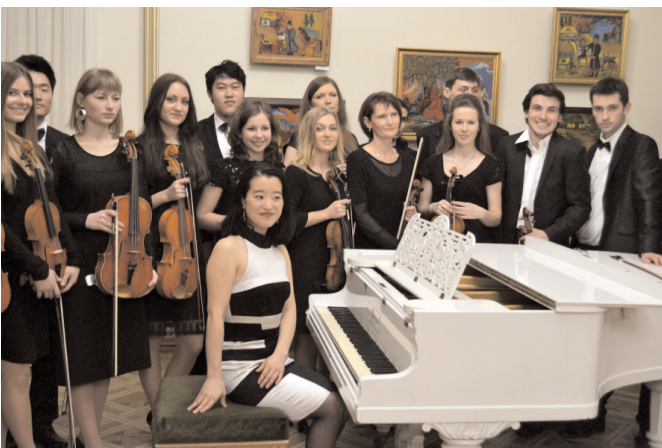
Чісато Кусунокі та камерний оркестр Інституту мистецтв

змогу почути безсмертні твори Й. С. Баха, Ф. Шопена, С. Рахманінова, М. Скорика, Т. Такеміцу. Аудиторія високо оцінила талант і професійність всіх виконавців, які заради високої мети, як культурної, так і гуманної, зібрались у залі музею Т. Г. Шевченка і презентували гостям концерт класичної музики.