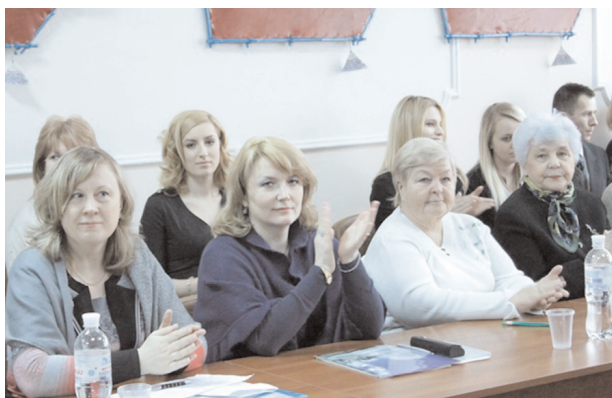
Висловлюючись на підтримку свого директора, колектив зазначав про потужний розвиток Інституту

“Я з особливим щемом ставлюся до цього Інституту, – зауважив очільник НПУ, – зважаючи на його глибоке коріння, поважну історію і особливо теперішню напружену працю згуртованого колективу викладачів, бажання вчитися студентів. Саме ви великою мірою формуєте імідж університету в очах іноземців, що перебувають в Україні. Ваші здібності вже високо оцінила влада й громадськість під час проведення Євро-2012 у Києві, Форуму міністрів освіти і науки європейських країн та інших знакових подій. Тому для Драгомановського вишу