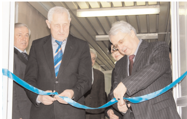
Тепер студенти мають новий сучасний комплекс

Кожен, хто переступить поріг одного із трьох залів, буде задоволений, бо на нього чекають досвідчені бібліотекарі, які можуть не тільки підказати, як знайти потрібну літературу, а й допоможуть скористатися технічними послугами. Відвідувачі матимуть можливість читати електронні книги і раритетні видання, сучасну періодику і книги іноземною мовою. А для викладачів взагалі море зручностей, яких вони не знали раніше при опрацюванні необхідної для них літератури. Технічні засоби прийдуть на допомогу замість звичайної ручки, можливе спілкування зі студентами у мережевому комп'ютерному класі.