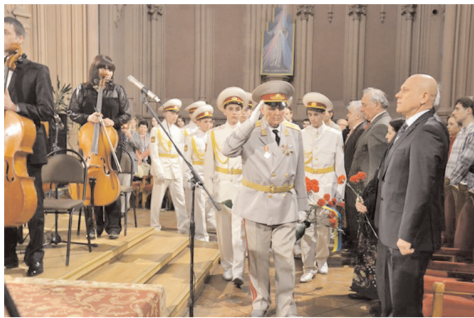
Захід розпочався з ушанування пам'яті і покладання квітів