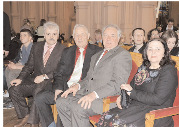
Ініціатором заходу є Драгомановський університет

У програмі були задіяні: Національний академічний заслужений український народний хор імені Г. Верьовки (художній керівник – Герой України, народний артист України, лауреат Національної премії імені Т. Шевченка, професор, проректор-директор Інституту мистецтв НПУ Анатолій Авдієвський ), хор реген-