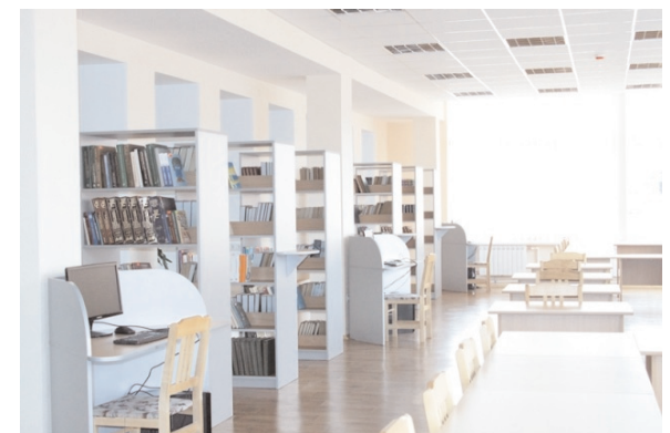
Все для успіху - книжки і комп'ютери поряд

Людмила БИСТРОВА – ДРОБОТ, провідний бібліотекар залу інформаційно-пошукових систем