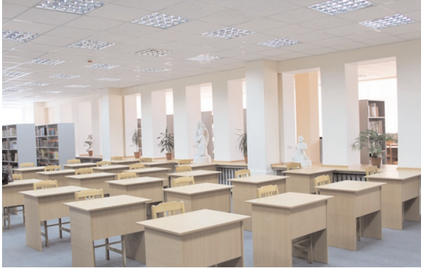
У залі враховано всі сучасні вимоги

ЯКЩО вам скажуть, що бібліотека переживає важкі часи, бо на зміну прийшли нові технології і електронні книги, – не вірте! Бо бібліотека ніколи не буде забута, поки є люди, які несуть світоч знань. Раритетна книга відкриє вам такі таємниці, які ви не знайдете ніде. Та навіть саме спілкування з такою книгою підносить вас на таку височину, якої ви ніколи не досягнете, працюючи в Інтернеті. А ще – живе спілкування з досвідченими бібліотекарями, які все життя присвятили книзі і знають великі таємниці пошуку цікавого і потрібного. Крім того, бібліотека удосконалює свою роботу, переходить на нові форми обслуговування, і саме головне – робить все можливе, щоб читачу було затишно і зручно.