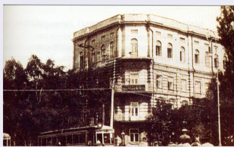
Будинок Комерційного інституту, який було передано Київському державному педагогічному інституті

У 1860 р. на базі ліквідованого Педагогічного інституту були створені Університетські педагогічні курси, пізніше – Вищі жіночі курси. З 1905 р. тут розпочали роботу вечірні жіночі курси, а згодом – жіночі курси іноземних мов.