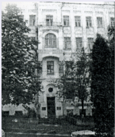
Будинок по Фундуклеївській (нині Б. Хмельницького), 51, в якому до 1913 р. знаходилися Вищі жіночі курси

У 1920 р. на основі історико-філологічного, фізико-математичного факультетів ліквідованого Київського університету, Київських вищих жіночих курсів, Київського учительського інституту, Київського Фребелівського педагогічного інституту та інших просвітницьких закладів створено Київський інститут народної освіти (КІНО) ім. М. Драгоманова.