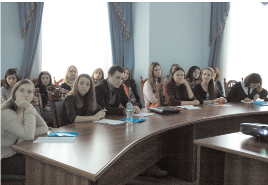
Учасники культурологічної секції мали актуальний і прикладний характер

були професори, доценти, аспіранти і студенти.