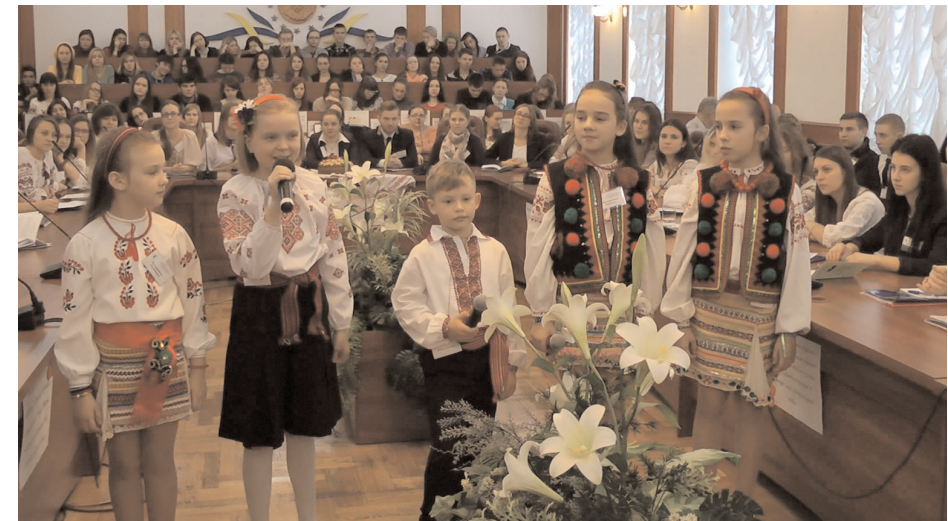
Дитячі виступи між доповідями учасників конференції