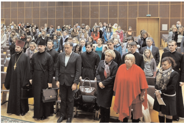
Студенти та викладачі могли ставити запитання учасникам круглого столу

Віктор Андрущенко вручив високу відзнаку Предстоятелю УПЦ Київського Патріархату Патріарху Філарету – медаль "Драгомановська родина", а також книги про історію й наукові школи НПУ імені М. П. Драгоманова.