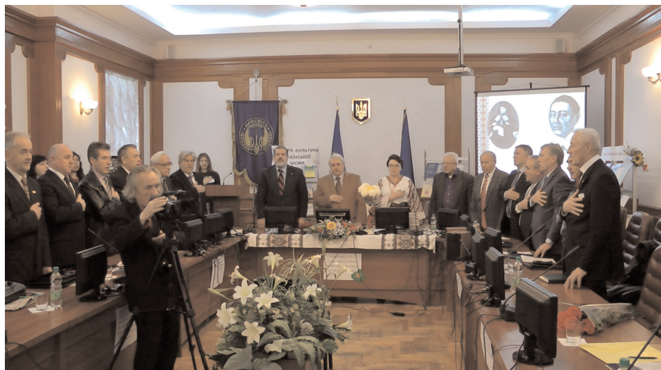
Виконання державного гімну на відкритті конференції у 2014 р., організатором якої є кафедра культури української мови

Кожен наш співвітчизник має усвідомити силу української мови, її першорядне значення в процесах розбудови національної держави, її вагу в духовному бутті всього українського народу й кожного з-посеред нас зокрема. “Слово – це Божа матеріалізація світу з першопочатком у ньому самому (себто у Богові). Через Слово постала Людина, Народ, Нація, Держава. Однак, отримавши цей найвищий дар, себто духовну матеріалізацію у слові, людина здебільшого перетворює мову на банальний засіб спілкування, зрештою, як і життя – лише на факт існування з малими чи великими матеріальними потребами. Через те тільки у руках великої людини слово сильніше за меч, а відтак лише в руках сильної влади воно, наче клей, з'єднує малі й великі країни. Отож, мова і життя у визначальному – тожодні” (Ірина Фаріон).