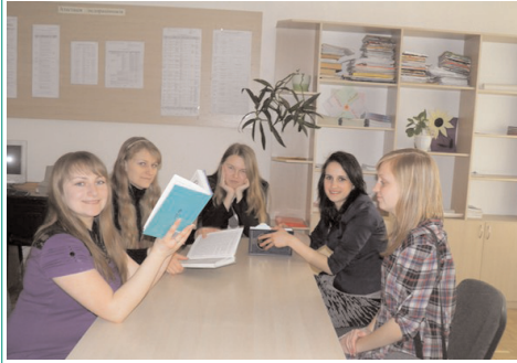
Обговорення в учительській

Традиційно щовесни студенти третього та четвертого курсу НПУ імені М. П. Драгоманова проходять пропедевтичну і виробничу педагогічну практику в школах міста Києва. Студенти Інституту іноземної філології, які проходили практику в ліцеї № 157, залишили відгуки про перші спроби вчителювання протягом педагогічної практики цих двох курсів.