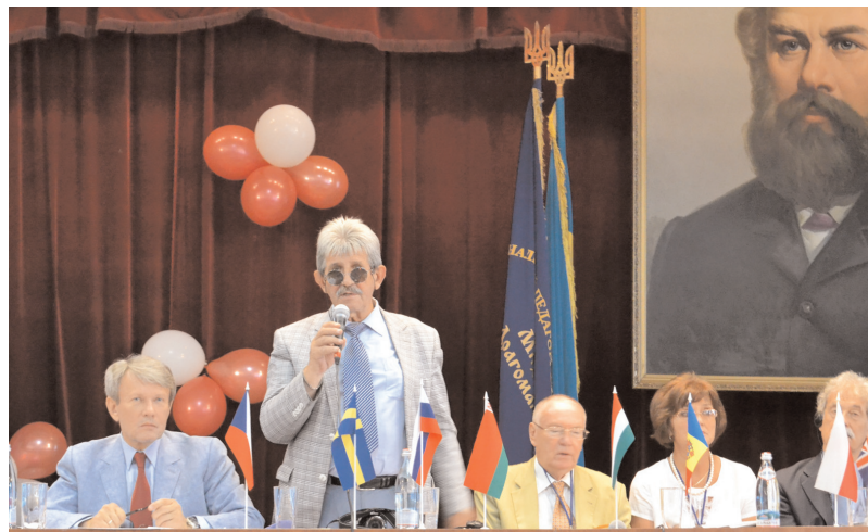
Урочисте відкриття конференції

З метою поширення знань про ААС в Україні і допомоги батькам та спеціалістам, що працюють з поширення знань про ААС нерозмовляючими дітьми, влітку 2013 року Інститут корекційної педагогіки та психології спільно з ВГО "Українська асоціація корекційних педагогів" та ВГО "Національна Асамблея інвалідів України" вперше в Україні провели IX Східно- та Центральноєвропейську Регіональну конференцію з проблем альтернативної та допоміжної комунікації . Ця конференція традиційно проходила в країнах ЄС, а проведення її в Україні було ініційовано західними колегами. У роботі конференції взяли участь представники 11 країн світу, серед яких Україна, Росія, Білорусь, Швеція, США, Польща, Молдова, Норвегія, Угорщина, Румунія, Великобританія. З усіх кутків України завітали до НПУ корекційні педагоги, науковці та батьки проблемних дітей. Загалом кількість учасників була понад 400 осіб.