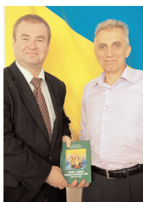
Автори презентованої праці