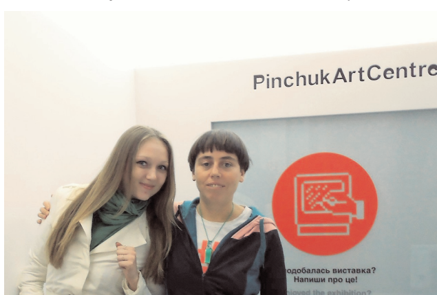
Автор інтерв'ю разом з художницею

знайти власний творчий шлях. Хоча здебільшого я орієнтуюсь не на класичні зразки, а на сучасників, які вже увійшли в історію мистецтва, – Олександр Гнилицький, Арсен Савадов, Ілля Чічкан. Я закінчила відділення скульптури Київської державної художньої школи, але багато часу проводила в Центрі сучасного мистецтва, де експонувались незвичні на той час картини.